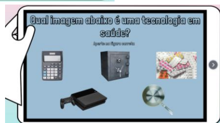
Jogo 1 – Filme 1 "Entendendo o processo de incorporação no SUS"