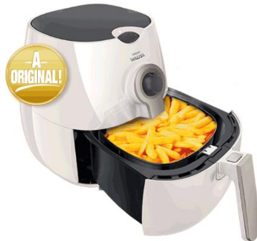
Walita Polishop - R$ 1.199,00