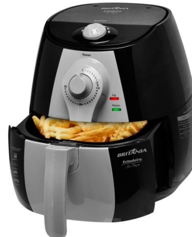
Britania Extra - R$ 399,00